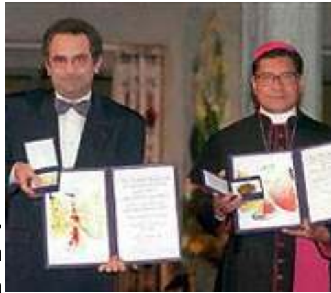
Ramos Horta e D. Ximenes Belo recebem o Prémio Nobel da Paz pelo seu trabalho em Timor-Leste